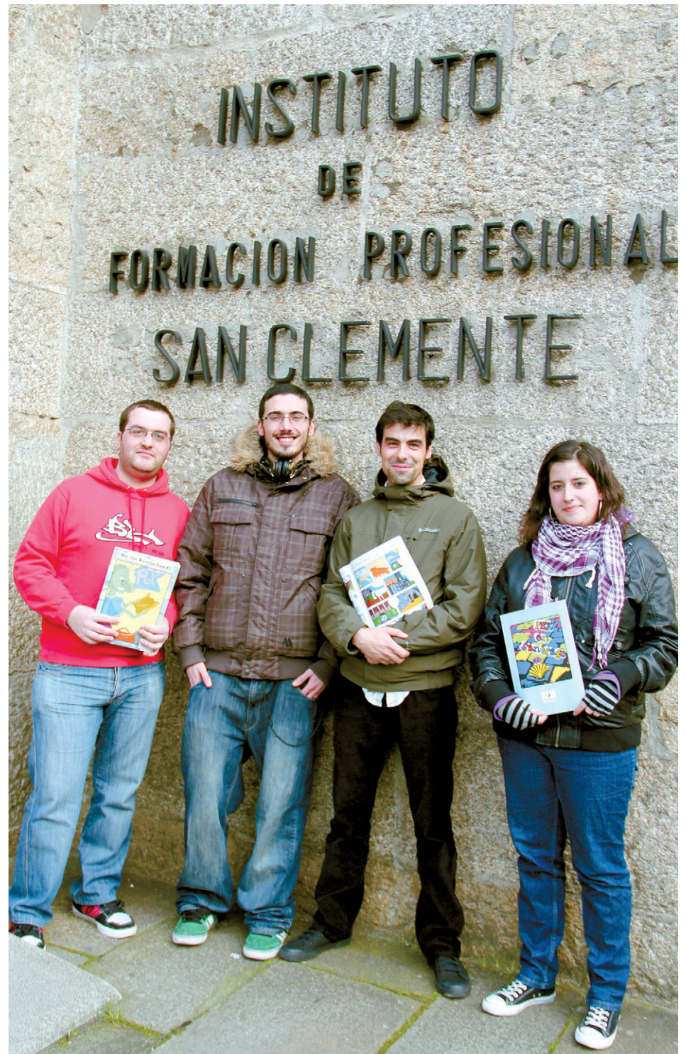
Gracias a Pek varios estudiantes impartieron talleres de diseño de cómics. IES SAN CLEMENTE

Además, este proyecto cuenta con la colaboración de la Concejalía de Cultura del Ayuntamiento de Santiago, gracias a la cual, varios de los estudiantes que participaron en Pek #1 impartieron un taller de Gimp y cómic en el Centro Sociocultural do Castiñeiriño de nuestra ciudad.